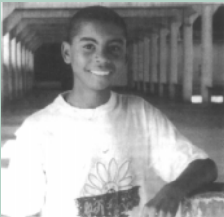
Foto cortesía del BID, Agosto de 1993. Banco Interamericano de Desarrollo.

Aunque los temas específicos abordados por los jóvenes en estas discusiones no pueden ser generalizados a otros lugares y culturas, ilustran la complejidad de los factores que influyen sobre las decisiones sexuales y las prácticas de salud reproductiva. Cuando se diseñan servicios para la juventud, los programas deben identificar cuáles son los temas que atañen a la juventud de un lugar en particular y trabajar con los adolescentes para desarrollar respuestas apropiadas.