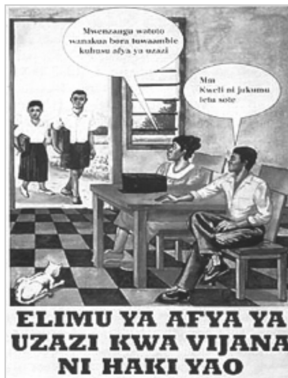
Este anuncio elaborado por la Asociación de Planificación Familiar de Tanzania el año 1995 pone énfasis en la responsabilidad que tienen los padres de educar a sus hijos en salud reproductiva.

Cómo lograr el apoyo de la comunidad. Los programas para adolescentes a menudo encuentran obstáculos para ganarse el apoyo de la comunidad, porque los adultos temen que el acceso a la educación y a los servicios pueda estimular la actividad sexual en los adolescentes. Luego de evaluar los programas, se ha encontrado que ello no es así (ver cuadro más adelante). Algunos programas han demostrado que explicar los objetivos a los padres, a los líderes religiosos y a los líderes comunitarios e invitarlos a participar en sesiones de discusión con adolescentes ayuda a mitigar la oposición. En Nyeri, la Asociación de Planificación Familiar de Kenya insta a los padres a acercarse a sus hijos para intercambiar información sobre temas de salud reproductiva, y estimula la existencia de un debate permanente respecto de estos temas. 24 En Uganda, el Programa para Mejorar la Vida Reproductiva de los Adolescentes (Program for Enhancing Adolescent Reproductive Life-PEARL) involucra en sus actividades a representantes del gobierno, ONGs, grupos comunitarios, gente joven y otros, en un intento por aumentar la consciencia sobre los temas de salud reproductiva, contribuir a la promoción, protección y defensa de los derechos reproductivos y entregar buenos servicios. 1