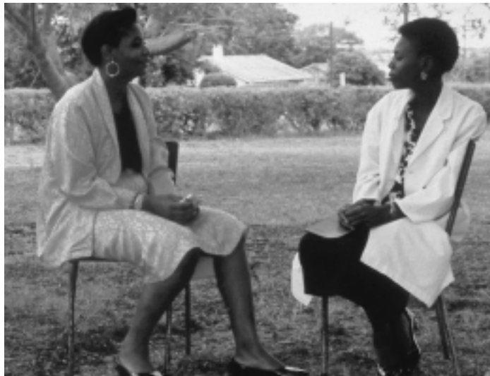
La consejería individual cara a cara acerca del riesgo de contraer el VIH puede ser clave en todo esfuerzo de comunicación. Un video realizado en Zambia llamado "Los desafíos de la Consejería sobre el VIH" muestra una sesión en la que participan un consejero en VIH y una mujer que vive en situación de riesgo.

Los anticonceptivos orales, otros anticonceptivos hormonales y los dispositivos intrauterinos (DIU) no brindan ninguna protección contra el VIH u otras ITS. Se debe alentar a las mujeres que usan esos métodos a que recurran simultáneamente a los condones para protegerse contra el VIH y el ITS. Algunos estudios han indicado que es posible que