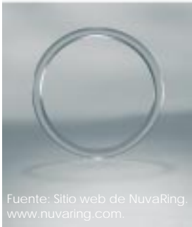
Fuente: Sitio web de NuvaRing. www.nuvaring.com .